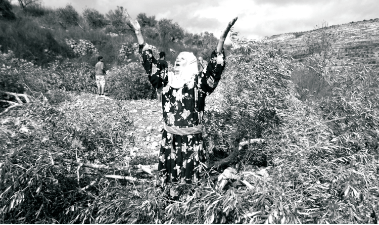
مزارعة تبدي غضباً من الاعتداءات الإسرائيلية على قطاع الزراعة

الاستهدافات من قبل جيش الاحتلال ومن قبل المستوطنين تسعى إلى النيل من الاقتصاد الفلسطيني وإبقاءه اقتصاداً ضعيفاً جداً لا يستطيع أن يصبح اقتصاد دولة مستقلة، وبالتالي نحن باختصار وبصراحة ليس أمامنا فرصة سوى الدفاع عما نمتلكه وإعادة بناء كل ما يدمره الاحتلال". وبينما تعاني بساتين الفاكهة في بيت أمر من قلة المياه تمتد أنابيب الماء في مزارع مستوطنة كرمي تسور المقابلة للبلدة لري الأشجار، لكن الأمر مختلف عند الفلسطينيين.