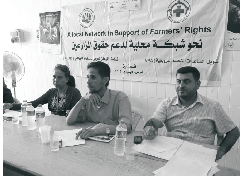
المتحدثون في الورشة