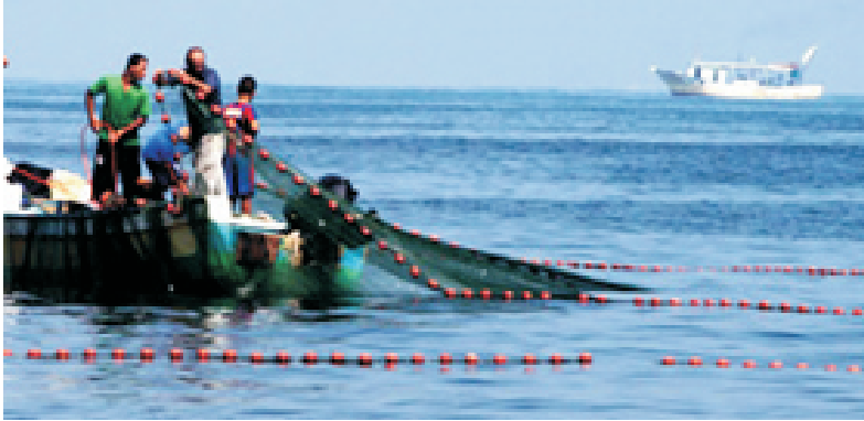
صيادون يعملون في صيد السمك قبالة زورق اسرائيلي

مؤسسات اتحاد لجان العمل الزراعي وجمعية التوفيق للصيادين، ومؤسسات حقوقية من أجل تشكيل لجنة للدفاع عن حقوق الصيادين.