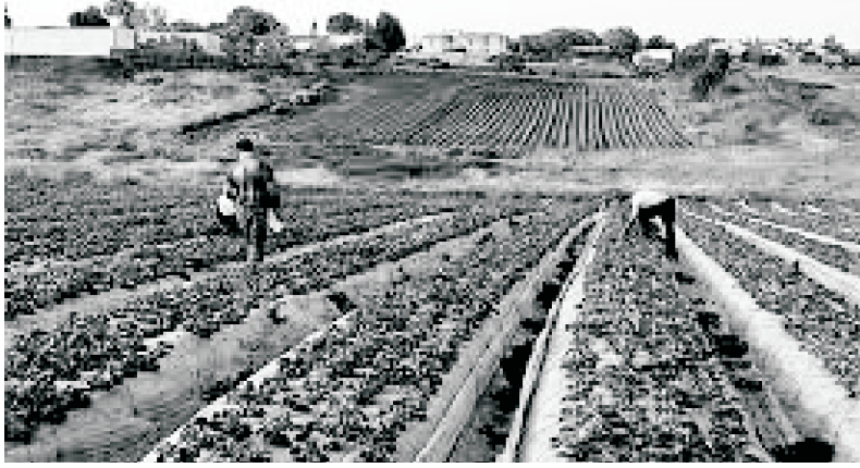
مزارعون أثناء عملهم في زراعة التوت الأرضي

أن تلحق بموسم التوت الأرضي بهذا الموسم. وأضاف: صحيح أن هناك حالة من الهدوء، لكن من يضمن عدم استئناف الاعتداءات الإسرائيلية في أي وقت، وقيام الآليات الإسرائيلية بالتجول فوق هذه المساحات، مشيراً بيده نحو أرض لا تقل مساحتها عن 20 دونم مغروسة بأشتال التوت الأرضي. وتابع: وقد يمر الموسم دون تجريف وعدوان، لكن ما يثير القلق أيضاً، هو تعيد إسرائيل إغلاق المعابر وعدم السماح بتصدير المحصول، حين بدء الموسم الحصاد والتسويق، وقتها ستغرق السوق المحلية به، وسيباع بأقل الأسعار ويمكن أن نصل إلى حد عدم قطف الثمار وإتلافها، وهو ما يشير إلى تكبدنا خسائر فائقة. يشار إلى أن إسرائيل كانت سمحت في العامين الماضيين بتصدير كميات محدودة من التوت الأرضي من غزة.