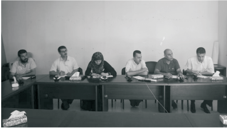
المتحدثون في اللقاء

تسعى لتأطير المزارعين و تشكيل إطار نقابي موحد لهم، منبهاً من مخاطر تشتت الجهود وضياها في حال لم تراعى هذه الجهود توجهات لجان المزارعين و حمايتها من التناقضات السياسية والقبلية والجغرافية.