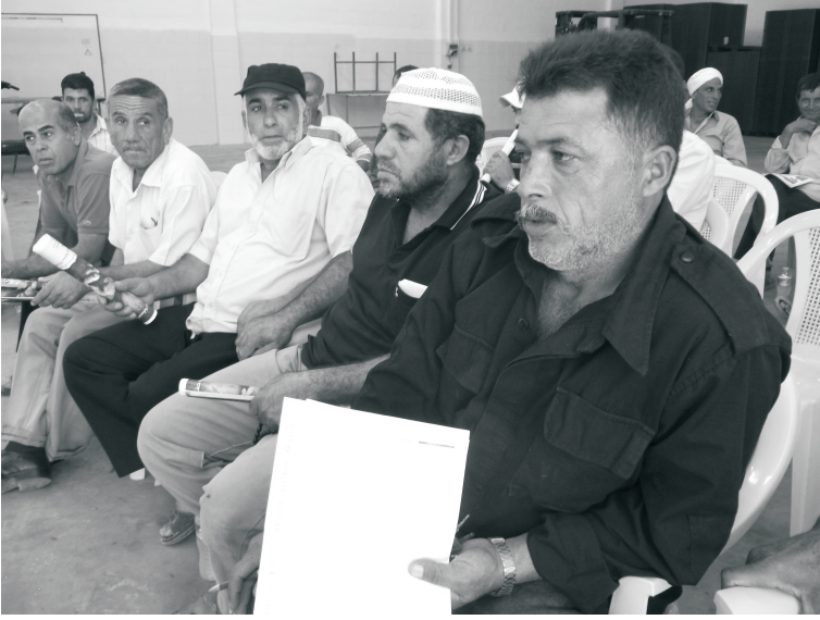
جانب من المشاركين