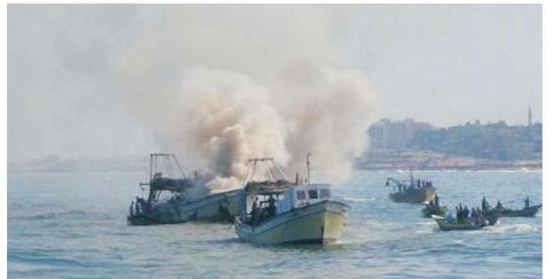
قوارب الصيادين تتعرض لقصف مدفعي