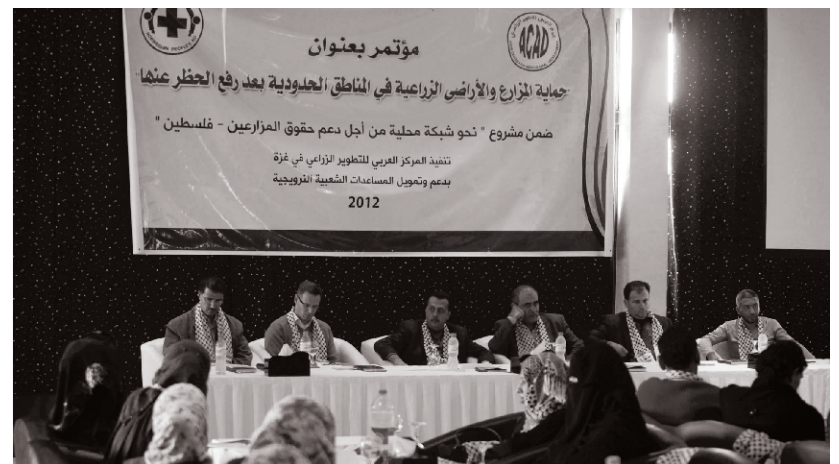
جانب من المؤتمر