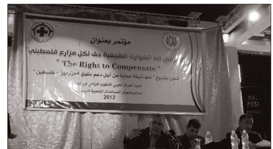
متحدثون ومشاركون في المؤتمر