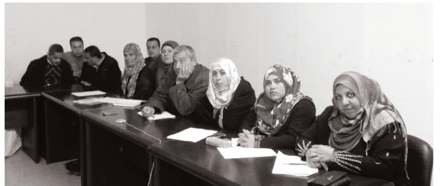
عدد من المشاركين في اللقاء