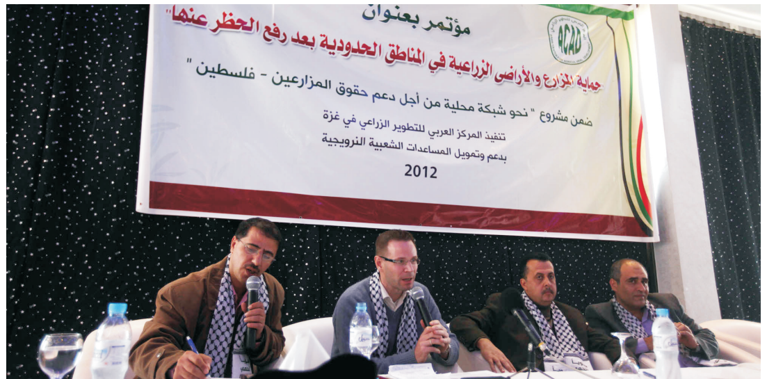
المتحدثون في المؤتمر