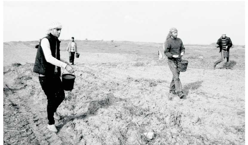
متطوعون يبذرون القمح في أراضي فلسطينية محايدة للمواقع العسكرية الفلسطينية